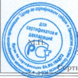
Схема сертификации - 1с